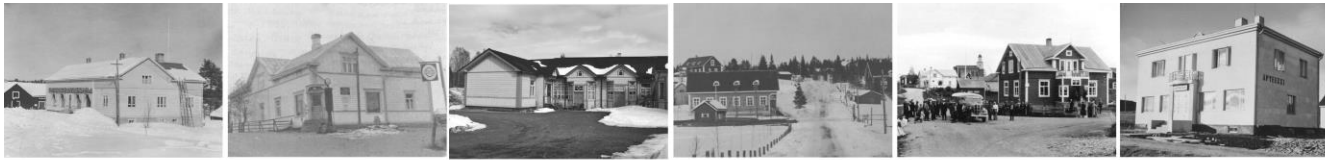
1. Osuuskauppa 2. Rovalan kauppa 3. Jalavan kauppa 4. Neljäntienrasteys, Lamminmäentalo, Siriniön Artun kahvila ja apteekki